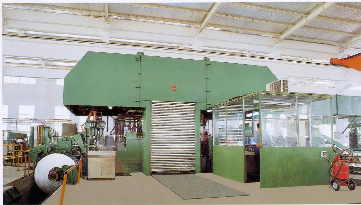
四重冷轧机 Cold rolling mill