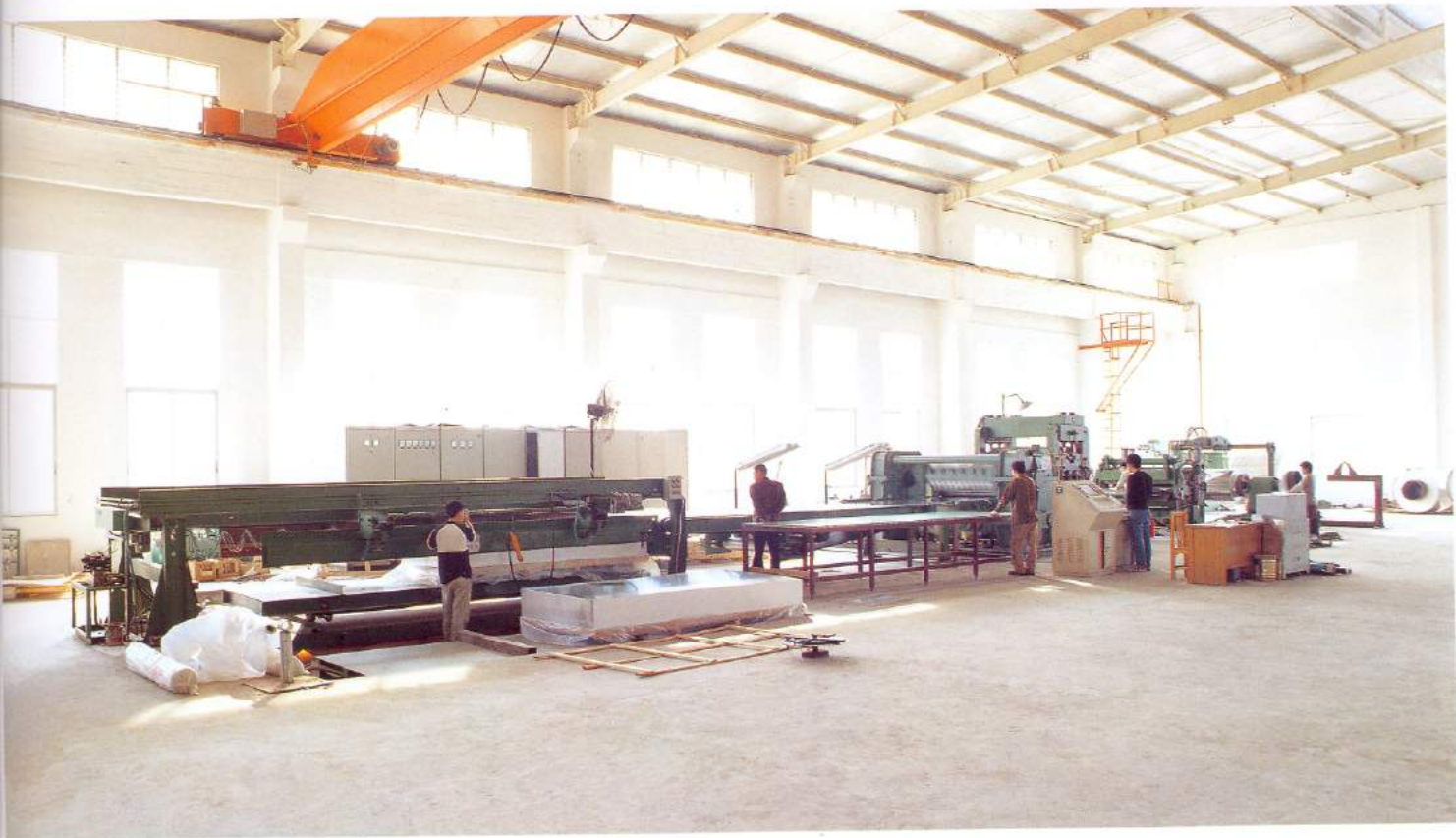
横剪机 Shearing machine